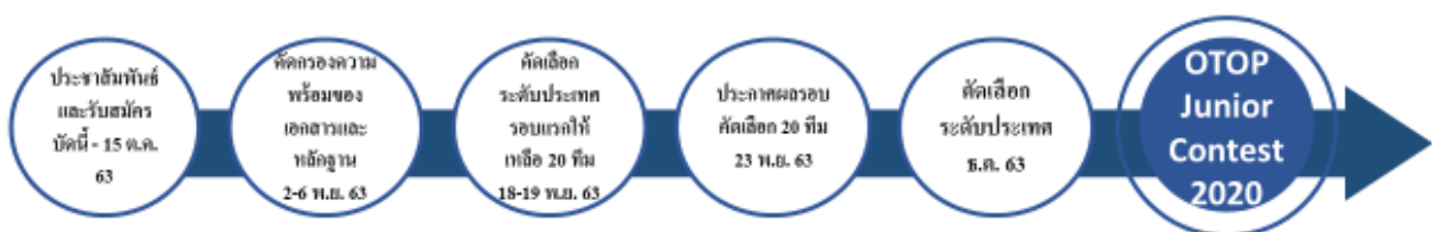
Timeline OTOP Junior Contest 2020